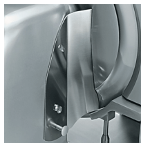
Parafetta in acciaio