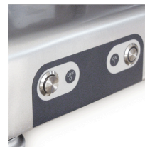
Comandi su carcassa (pulsanti isolati IP67)