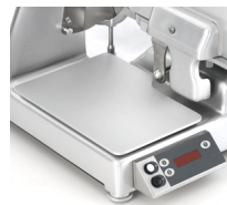
Applicazione bilancia opzionale