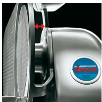
Ampio spazio tra lama e corpo macchina